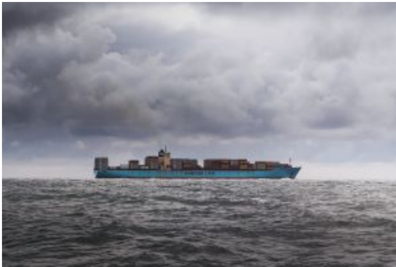
Ballastwasser: Das Wasser, das alle

Frachtschiffe aufsaugen, um stabil im Wasser zu liegen und dann quer durch die Welt Ware transportieren. Nach Expertenmeinung ist dieses Ballastwasser sogar das grösste Umweltproblem, das von Seeschiffen ausgeht. Denn mit ihm werden auch viele Organismen in fremde Lebensräume verschleppt.