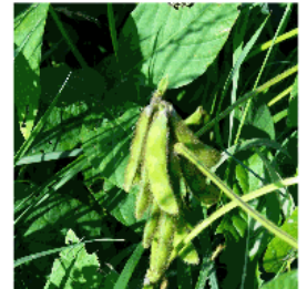
Sojabohnen in einem Feld in Winterthur.