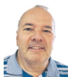
Peter C. Müller Trinkwasserverband SVGW