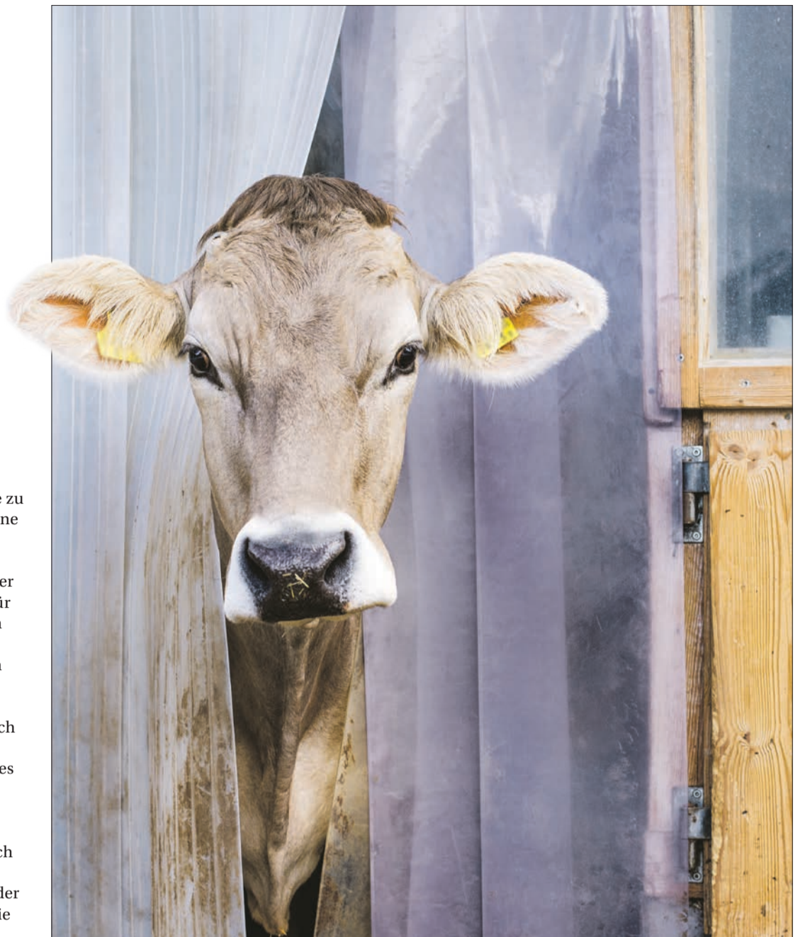
Wenn der Konsument bereit ist, für höhere Tierwohlstandards zu bezahlen, muss das genutzt werden. Das ist gut für die Konsumenten, die Bauern und dürfte auch die Kühe freuen.

Dass Coop jetzt zwei dieser Programme, namentlich BTS und RAUS, als Standard für den höheren Milchpreis verwendet, macht zwei Dinge deutlich: Erstens wächst auch im Handel das Bewusstsein, dass positive externe Effekte sehr wohl vom Konsumenten bezahlt werden. Und das liegt zweitens daran, dass sich auch die Konsumenten vermehrt für Fragen der Nachhaltigkeit